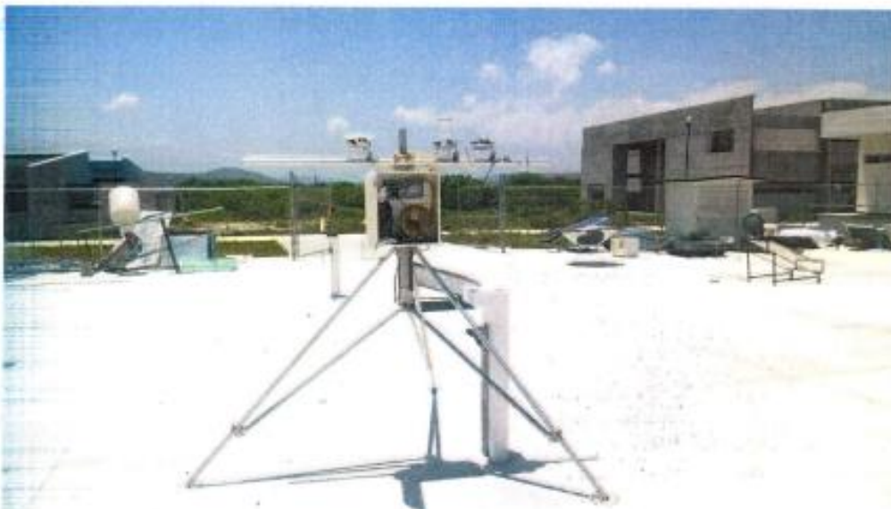
Kit de equipos necesarios para la determinación real de la radiación solar que existe en esa zona del estado de Chiapas y con los que es posible saber que tan eficientes será el trabajo de las celdas y equipos fotovoltaicos que se usan. Podemos ver el piranómetro, pirheliómetro y heliógrafo.