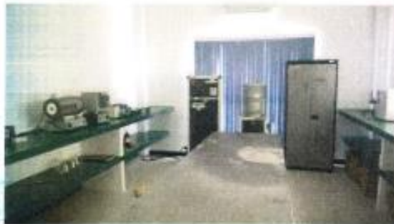
Vista general del laboratorio donde se llevan a cabo las prácticas para las limpiezas y síntesis de células fotovoltaicas.