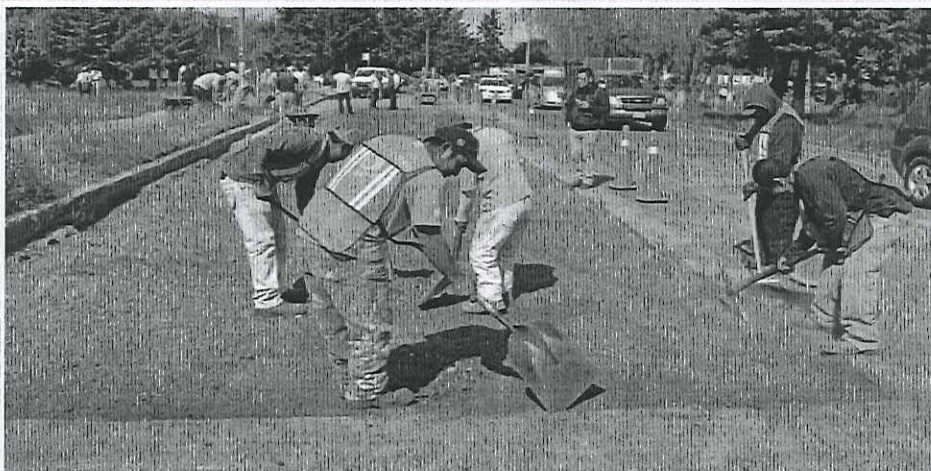
Más de 29 kilómetros de vialidades han sido atendidos a través del Programa Emergente de Bacheo que inició el gobierno de Cuautitlán Izcalli. El objetivo es llegar a 35 kilómetros e iniciar con vialidades secundarias. El deterioro de la carpeta asfáltica se agravó por la falta de mantenimiento desde hace varios meses.

El gobierno municipal tiene proyectado bachear y repavimentar colonias al interior de pueblos y fraccionamientos, en una primera etapa sólo serán vialidades principales y posteriormente los trabajos serán al interior de pueblos y demás colonias.